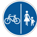
Getrennter Geh- und Radweg

Gemeinsame Nutzung der Verkehrsfläche auf gesamter Breite, Radfahrende sollen Rücksicht auf Gehende nehmen.